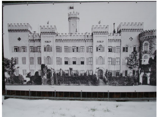
Saisonauftritt im März, u. a. das ehemalige Schloß Altfranken